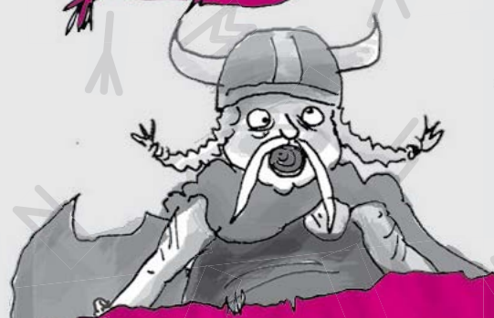
هیگر شکم قُرمبه