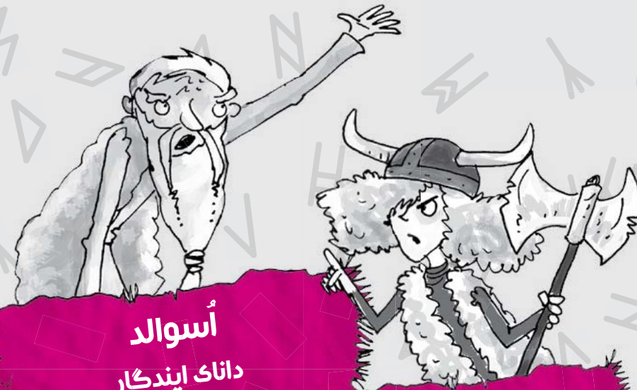
اُسوالد داناک ایندگار