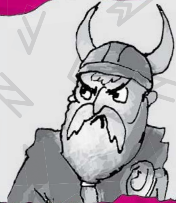
مگنس استخوان خُردکن