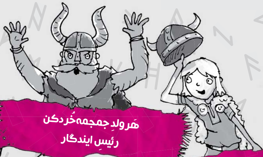
مَهرِ ولَدِ جَمجمه خُردکن رئیسِ ایندگار