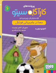
معما در جام جهانی فوتبال

پرونده‌های کارآگاه سیتو و دستیارش چین می‌ادو را دنبال کن!