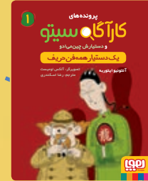
یک دستیار همه‌فن حریف