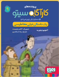
یک داستان خیلی مغناطیسی