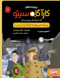
پرونده‌ی ویژه: فراتر از ترس