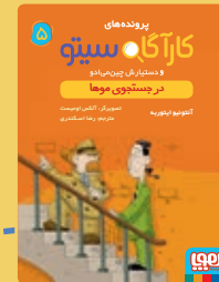
در جستجوی موها