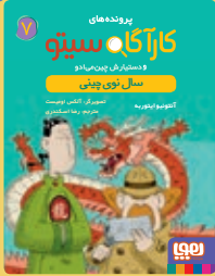
سال نوی چینی