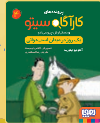
یک روز در میدان اسب‌دوانی