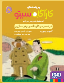
در دسر در کارخانه‌ی چترسازی