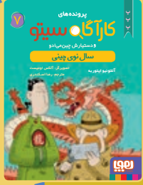
سال نوی چینی