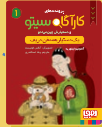
یک دستیار همه فن حریف