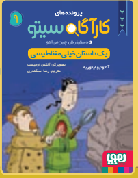
یک داستان خیلی مغناطیسی