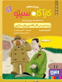
فردی سر در کارخانه‌ی چترسازی