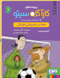
معما در جام جهانی فوتبال