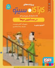
در جستجوی موها