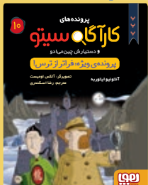
پرونده‌ی ویژه: فراتر از ترس