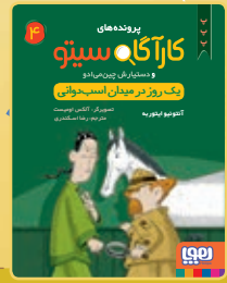
یک روز در میدان اسب‌دوانی