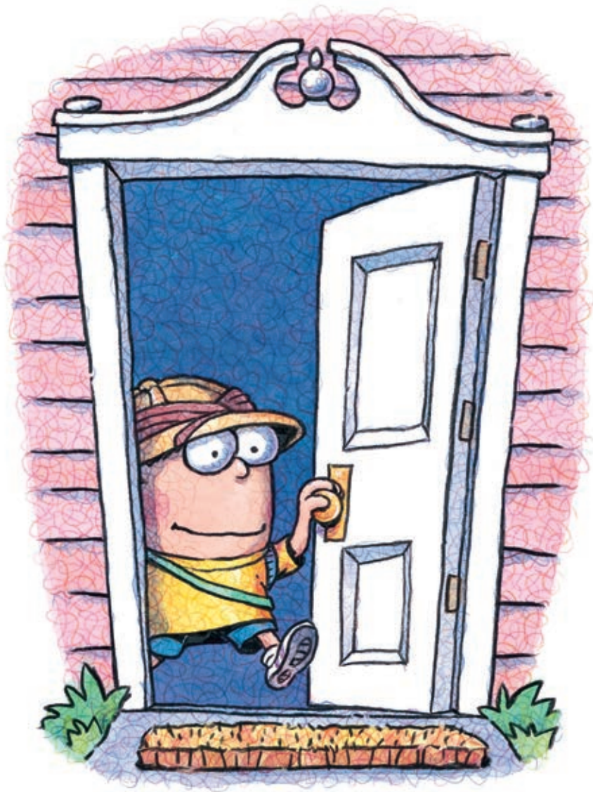
یک پسری بود که رفتش پیاده روی.