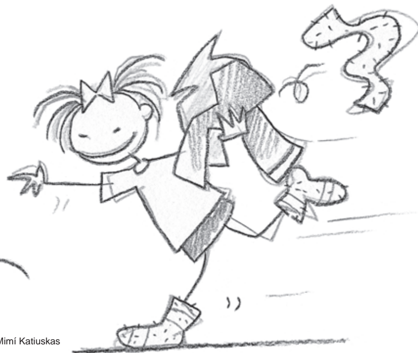
1. Mimi Katiuskas

خلاصه اینکه جمعه بود. از ویدئوکلپ جدیدترین فیلم دزد دریایی محبوبان میمی کاتیوسکاس ۱ را کرایه کرده بودیم. البته قبلاً توی سینما دیده بودیمش؛ ولی خیلی دلمان می خواست راحت روی مبل لم بدهیم و باز هم مجذوب شیطنت های میمی و دوستانش بشویم که دریاها ی روی زمین را می پیمایند.