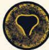
وزغ شکم‌آتشی اروپایی