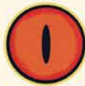
قورباغه‌ی درختی چشم‌قرمز