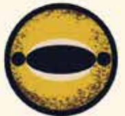
وزغ رودخانه‌ی کلرادو