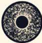
قورباغه‌ی گوجه‌ای ماداگاسکار