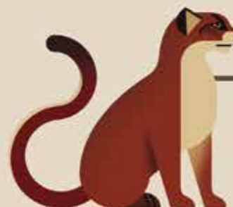
تبار گربه‌ی خلیجی برای مثال: گربه‌ی خلیجی / گربه‌ی سرخ بورنئویی