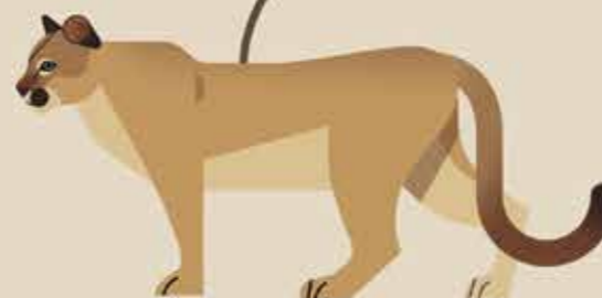
تبار پوما برای مثال: پوما / شیر کوهی