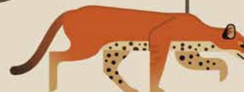
تبار کاراکال برای مثال: گربه‌ی زرد آفریقایی