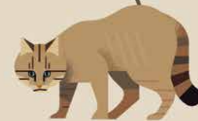
تبار فلیس برای مثال: گربه‌ی کوهی چینی