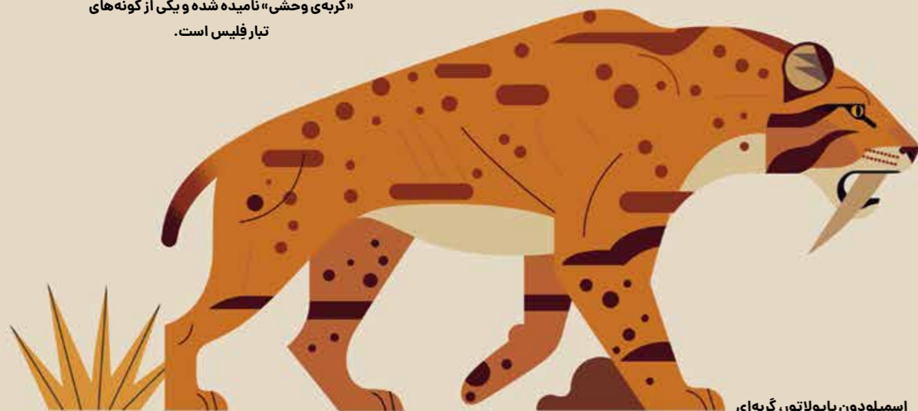
اسمیلودون پاپولاتور، گربه‌ای که اکنون منقرض شده است.