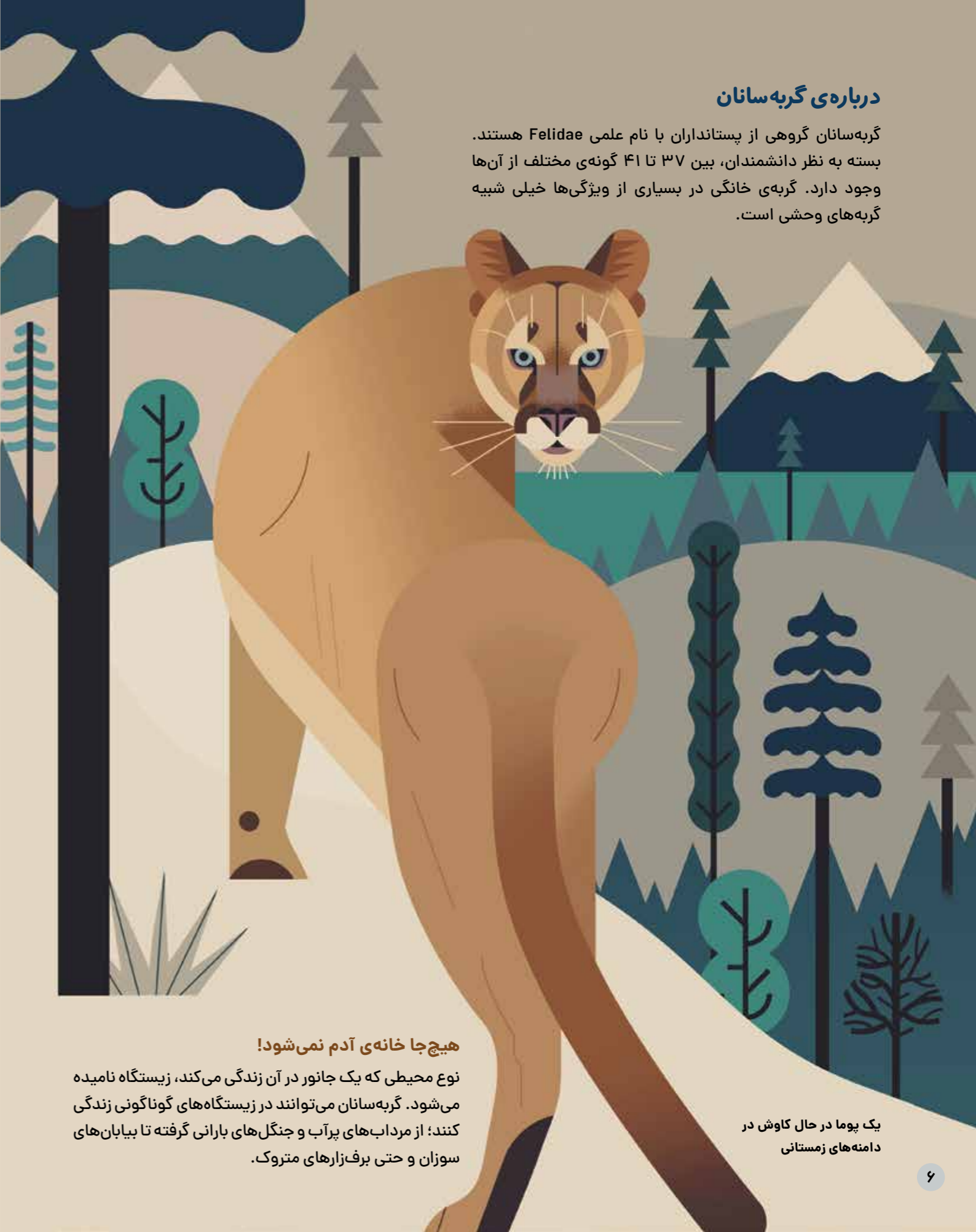
یک پوما در حال کاوش در دامنه‌های زمستانی

گربه‌سانان گروهی از پستانداران با نام علمی Felidae هستند. بسته به نظر دانشمندان، بین ۳۷ تا ۴۱ گونه‌ی مختلف از آن‌ها وجود دارد. گربه‌ی خانگی در بسیاری از ویژگی‌ها خیلی شبیه گربه‌های وحشی است.