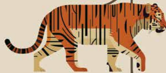
تبار پلنگ برای مثال: ببر

جانوران شبیه به گربه‌سانان حدود ۵۰ میلیون سال است که وجود داشته‌اند، اما گربه‌سانان وحشی امروزی حدود ۱۶ میلیون سال پیش آغاز به تکامل کردند. تکامل فرایندی است که طی آن جانوران در طول زمان تغییر می‌کنند. برخی ویژگی‌ها از نسلی به نسل دیگر منتقل می‌شوند و به بقای جانداران کمک می‌کنند. گونه‌های امروزی گربه‌سانان بر اساس تاریخچه‌ی تکاملی‌شان به ۸ گروه تقسیم می‌شوند.