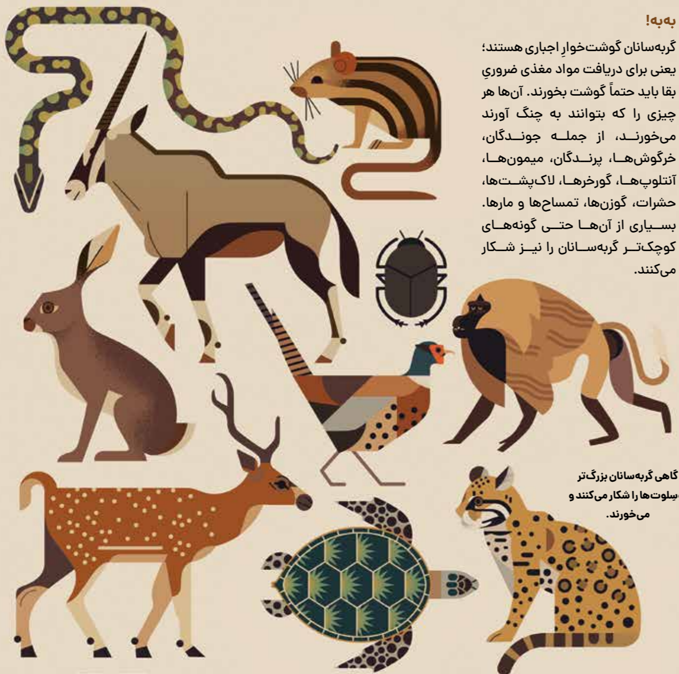
رژیم غذایی متنوع گربه‌سانان