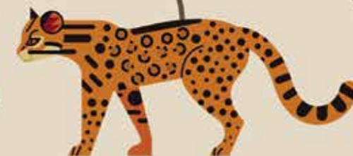
تبار اوسلوت برای مثال: اونسیلا