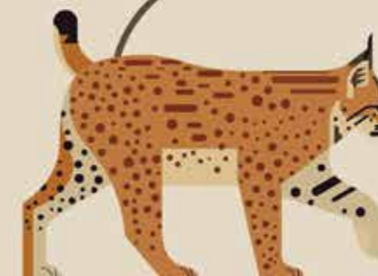
تبار سیاه‌گوش برای مثال: سیاه‌گوش اوراسیایی