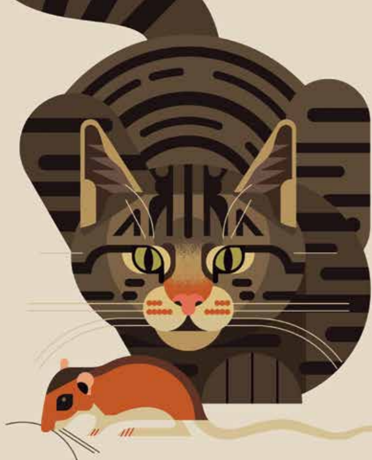
این گونه از گربه‌سانان وحشی به طرز خلاقانه‌ای «گربه‌ی وحشی» نامیده شده و یکی از گونه‌های تبار فلیس است.

گربه‌های اهلی امروزه از محبوب‌ترین حیوانات خانگی در جهان به شمار می‌آیند، اما فرایند وارد شدن آن‌ها به زندگی انسانی هزاران سال پیش آغاز شد. پژوهش‌های اخیر نشان می‌دهد که گربه‌ها حدود ۹ تا ۱۰ هزار سال پیش، هم‌زمان با آغاز کشاورزی، زندگی‌کردن در کنار انسان‌ها را شروع کردند. انسان‌ها در آن زمان به کشت و ذخیره‌ی غلات می‌پرداختند و این کارشان جوندگان گرسنه‌ی بسیاری را جذب می‌کرد؛ هجوم جوندگان هم به نوبه‌ی خود پای گربه‌های وحشی را به محیط‌زیست انسان‌ها باز کرد. این گربه‌های وحشی با ماندن در اطراف سکونتگاه‌های انسانی برای دسترسی آسان به غذا، به تدریج اهلی شدند و در همان حال نقش مؤثری در کنترل آفات ایفا کردند.