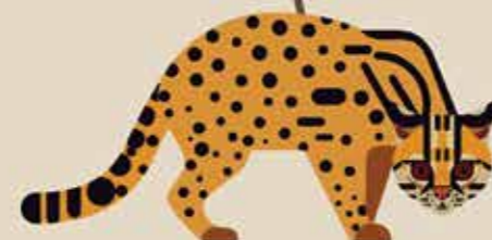
تبار گربه‌ی پلنگی برای مثال: گربه‌ی پلنگی / گربه‌ی بنگالی وحشی