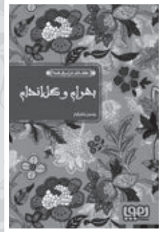
• بهرام و گل اندام