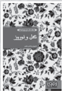
• گل و نوروز