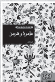
• عامره و هرمز