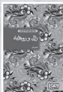
• زال و رودابه