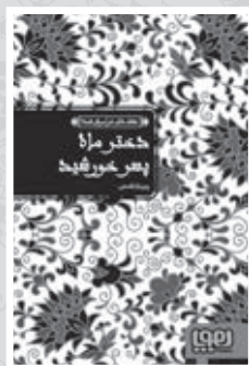
• خاترمه، پسر خورشید