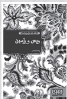
• ویس و رامین