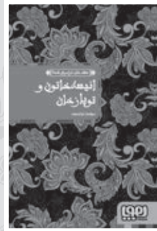
• انيسه خاتون و توپان خان