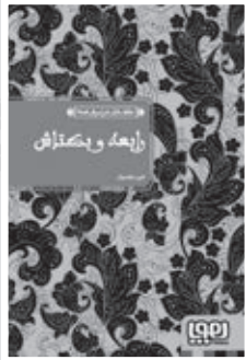
• رابعه و بكتاش