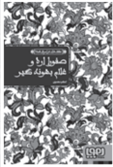
• صفورا آرذ و غلام بهونه گير