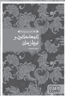
• انيسه و توپانخان