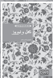
• گل و نوروز