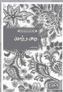
• ویس و رامین