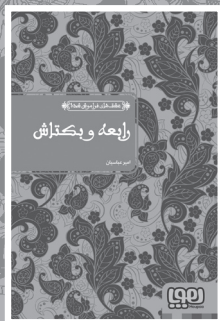
• رایعه و بکتاش