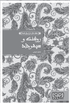
• روشنگر و سيخبرگاز