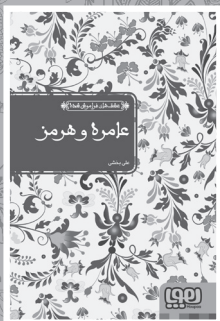
• عسمره و شرمز