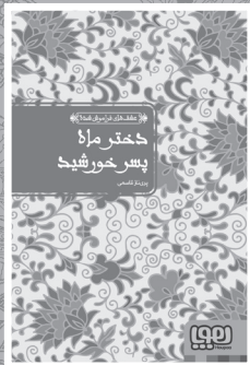
• دختر مراد، پسر خورشيد